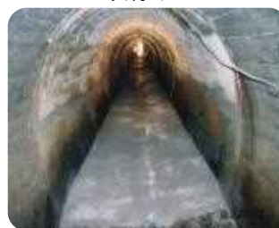
導水路トンネル敷