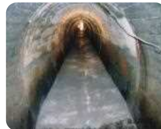
導水路トンネル敷